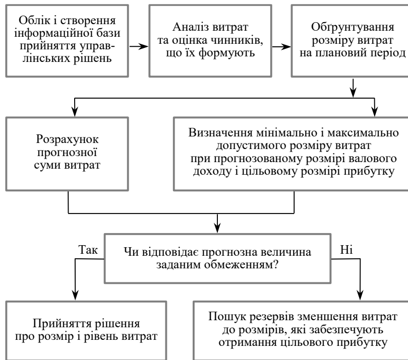
Рис. 2. Взаємозв'язок і взаємодія облікової функції управлінського обліку з іншими функціями управління в процесі прийняття рішень

Зважаючи на те, що управлінський облік – це інтегрована система різних економічних дисциплін, то і метод управлінського обліку включає в себе (рис.3):