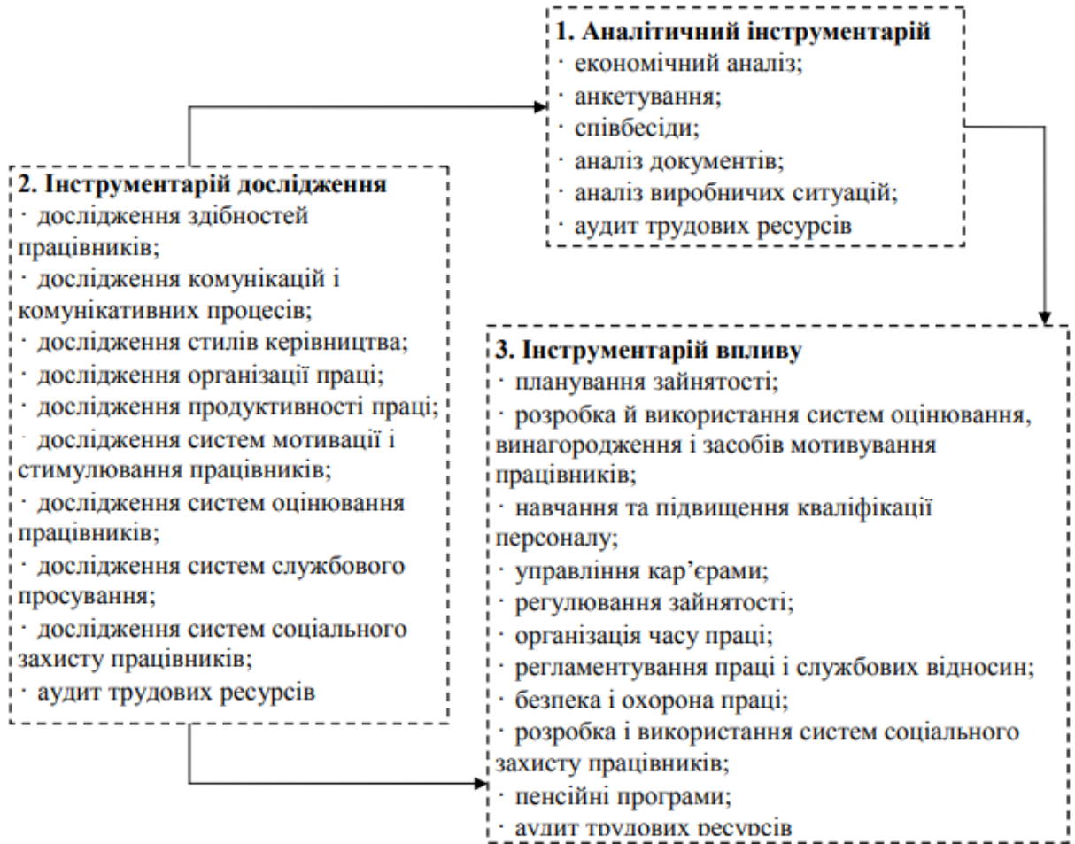
Рис. 1. Інструментарій управління трудовими ресурсами організації

Крім того, завданням управління трудовими ресурсами організації є забезпечення відповідності людських ресурсів організації таким вимогам: